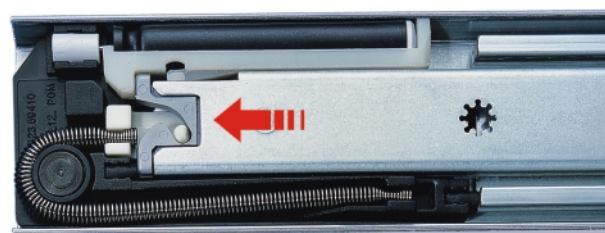
Sortie totale avec "Soft Control" en position fermée