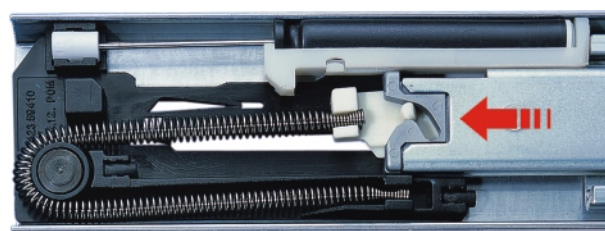
Sortie totale avec "Soft Control" en position ouverte